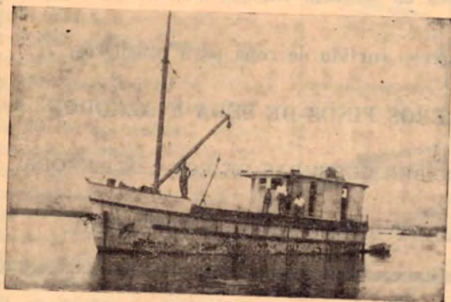
Lancha LA GAVIOTA.