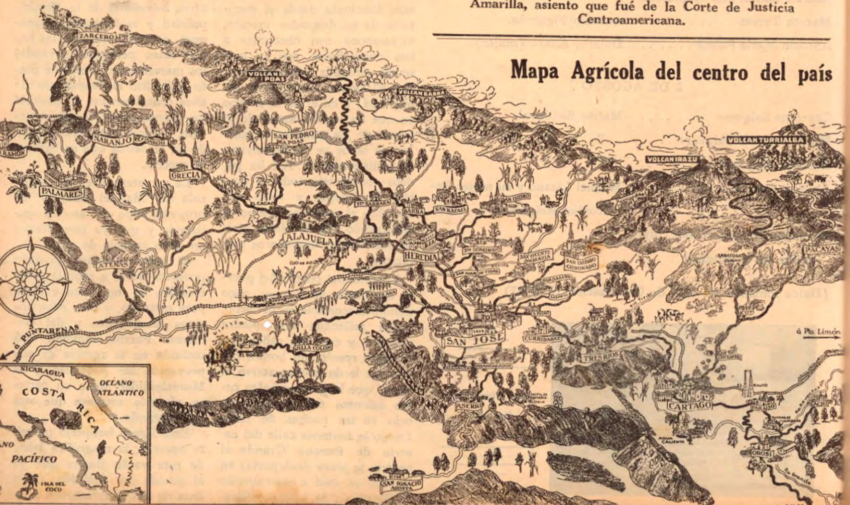
Mapa Agrícola del centro del país