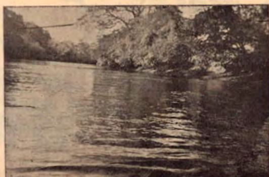
Río Blanco en Bebedero

(Datos tomados del exp. de Gobernación N° 8727)