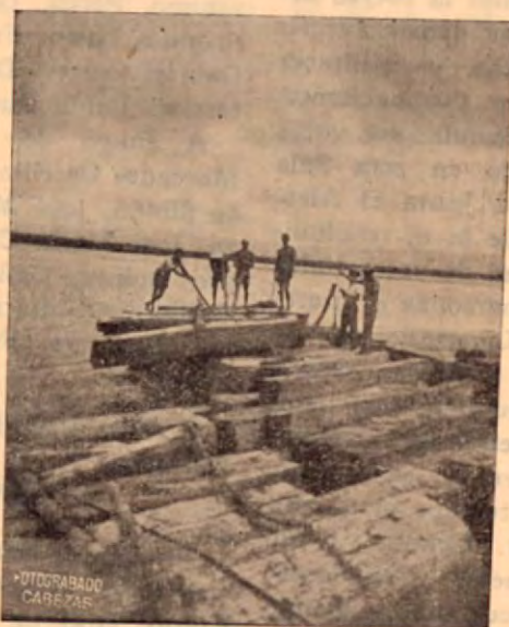
Amarre de la madera en el río.