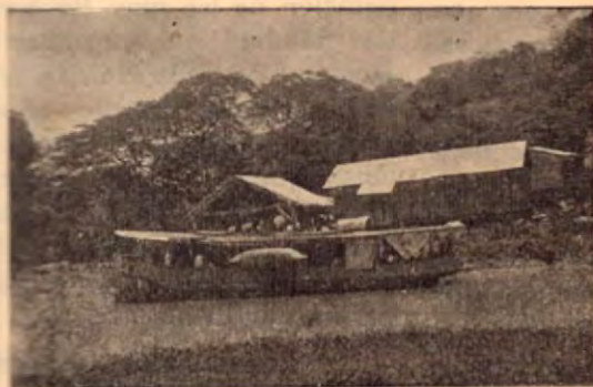
Llegada de la Lancha Correo a Bolsón.

Pero hay algo que no debemos dejar en el tintero. En Parrita se está verificando una transformación. Después de haber sido un centro vital importante en el desenvolvimiento bananero, y haberlo perdido, en no lejano tiempo será para el país un centro agrícola de grandes proporciones. Actualmente produce 32,000 quintales de arroz, 8,000 de frijoles, el maíz que se consume en la región, unos