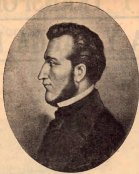
GENERAL DON FRANCISCO MORAZAN

Santa Cruz de Guanacaste y el General Morazán.