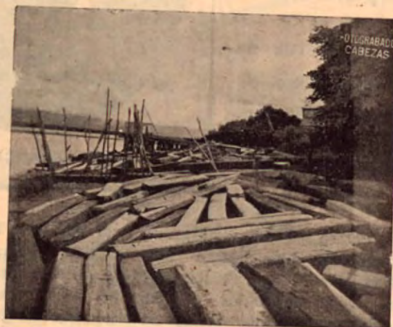
Uno de los patios de madera en el puertecito